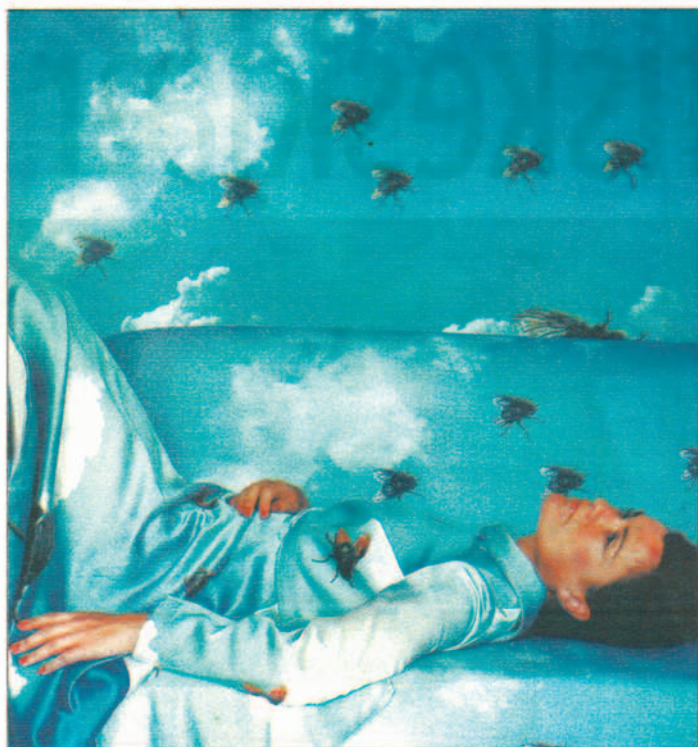
Kunstneren Abigail Lane dekorerer både seg selv og interiøret med fluemønstre.